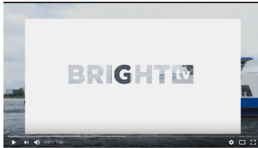
Wees Wijs met Wifi: de risico's van publieke wifi-hotspots

Kijk op YouTube naar https://www.youtube.com/watch?v=nxJG4J36Hpw of zoek op YouTube naar 'Wees Wijs met Wifi: de risico's van publieke wifi-hotspots'