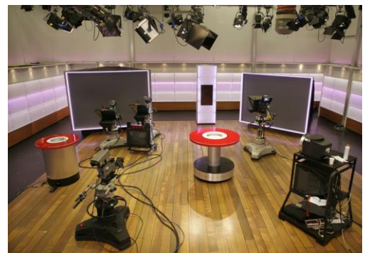
Studio NOS 1

Let op: plaats niet zomaar iets online; wees weer alert op de privacy van cliënten en collega's en hun toestemming.